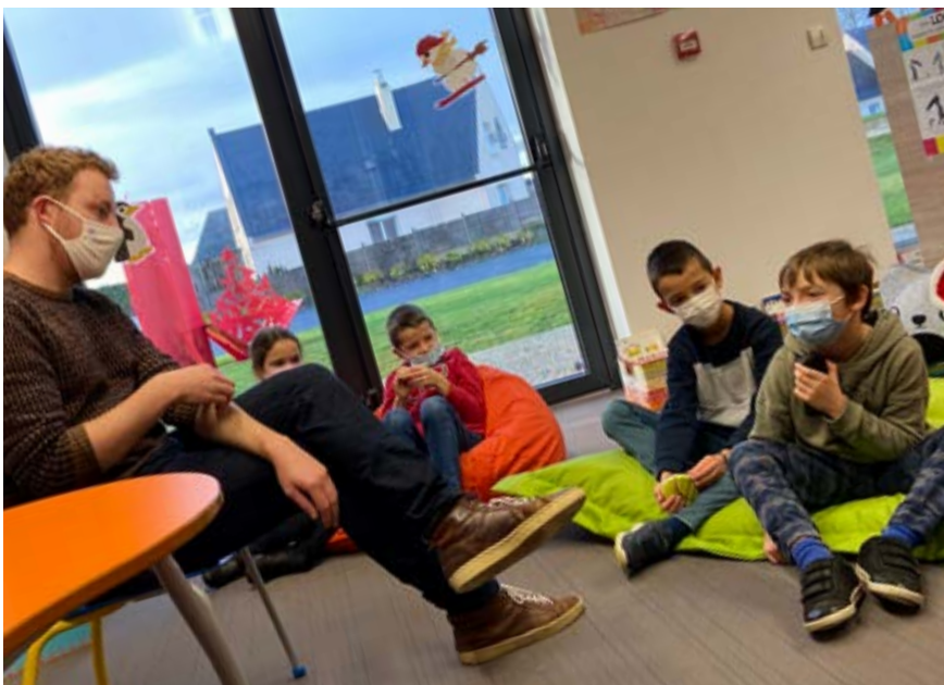
Arrivés à la médiathèque de Mené, les élèves sont invités à partager une petite activité brise-glace pour se mettre dans l'ambiance de cette matinée radio et se familiariser avec l'enregistreur.